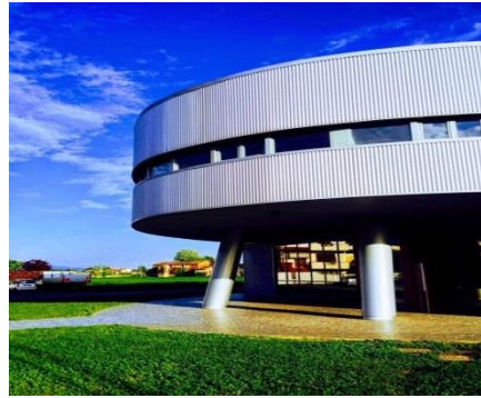
Biblioteca Comunale di Ponte Buggianese, opera realizzata dall'architetto Massimo Mariani

Dall'esterno posso apparire affascinata da dicotomie inconciliabili: guerra e pace, passato e presente, crimine e giustizia, maschio e femmina, potere e mancanza di potere... Ma come è vero per i confini naturali, cioè che esiste sempre una terra di nessuno, mi rendo pienamente conto di tutto ciò che vive e brulica fra due opposti: qui è il succo, la scintilla e il pungiglione abitano qui; ed è qui che come persona, scrittrice e studiosa preferisco passeggiare.