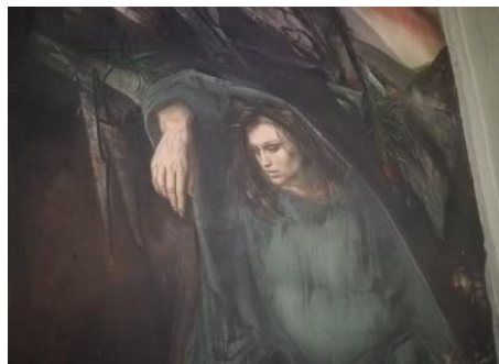
Particolare di uno dei monumentali affreschi del maestro Pietro Annigoni presenti nel Santuario della Madonna del Buon Consiglio a Ponte Buggianese.