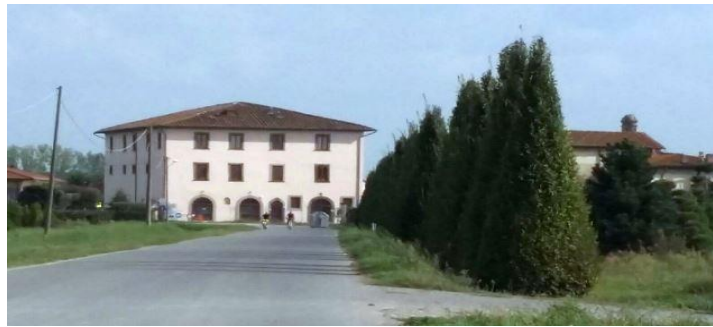
Dogana del Capannone: importante edificio sulla Via Francigena, sede tra l'altro del Museo dell'Eccidio del Padule di Fucecchio